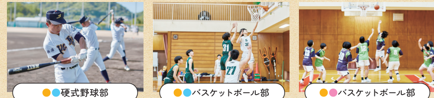
●硬式野球部 ●バスケットボール部 ●バスケットボール部