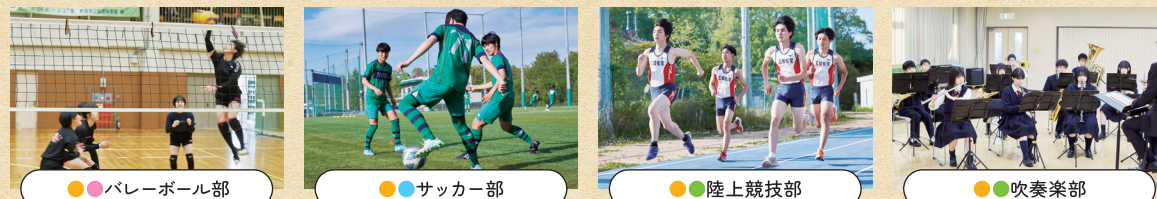
●バレーボール部 ●サッカー部 ●陸上競技部 ●吹奏楽部

運動部 ●水泳部 ●テニス部 ●ソフトテニス部 ●卓球部 ●アーチェリー部 ●少林寺拳法部 ●剣道部 ●ダンス部